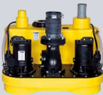
COMPLI 1000 – VOOR MEER ZEKERHEID

Bij meerdere wooneenheden of industriële gebouwen zoals hotels of restaurants is naast meer vermogen ook meer zekerheid vereist. Daarom is de compli 1000 een dubbele installatie met twee pompen op één reservoir. Deze schakelen ofwel afwisselend of werken bij piekbelasting samen.