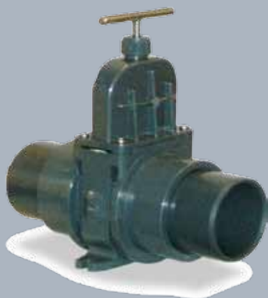
PVC toevoerafsluiter DN 100 of DN 150 met gelijkde buissteunen voor tijds- en plaatsbespa- rende directe aansluiting aan de toevo- erklemflens.