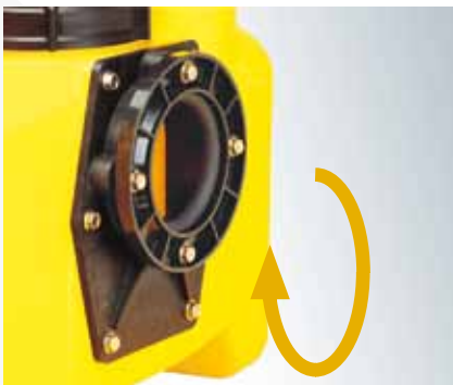
Klemflens in de hoogte verstelbaar bij de compli 400