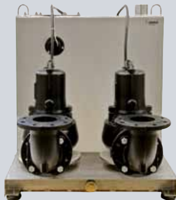
COMPLI 1200, 1400 UND 1600 - IN ROESTVRIJSTAAL

Deze opvoerinstallaties met het snijsysteem MultiCut werden speciaal voor de verwerking van speciale objecten zoals mobiele sanitaire inrichtingen, toiletten in productiehallen, weekendverblijven of woonboten ontwikkeld. Het snijsysteem MultiCut verkleint de gebruikelijke bijmengsels in het huishoudelijke afvalwater en maakt aldus het gebruik mogelijk van persleidingen met kleinere diameter.