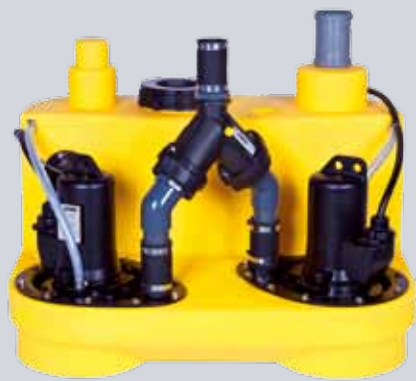
COMPLI 100, 500 EN 1000 MULTICUT

Deze opvoerinstallaties met het snijsysteem MultiCut werden speciaal voor de verwerking van speciale objecten zoals mobiele sanitaire inrichtingen, toiletten in productiehallen, weekendverblijven of woonboten ontwikkeld. Het snijsysteem MultiCut verkleint de gebruikelijke bijmengsels in het huishoudelijke afvalwater en maakt aldus het gebruik mogelijk van persleidingen met kleinere diameter.