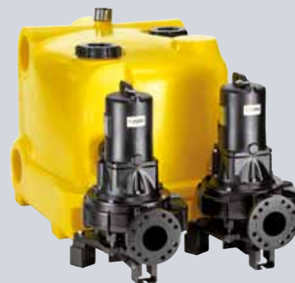
COMPLI 1500/COMPLI 2500 – VOOR DE HOOGSTE VEREISTEN

De compli 1200 met een inzamelvolume van 350 l vormt de ideale oplossing voor meerdere wooneenheden, industriële bedrijven of ziekenhuizen. Zij is gemakkelijk te installeren en eenvoudig te onderhouden. De toevoer aan de achterzijde kan zowel in de hoogte variabel (560 – 700 mm) alsook zwenkbaar (180°) gemonteerd worden.