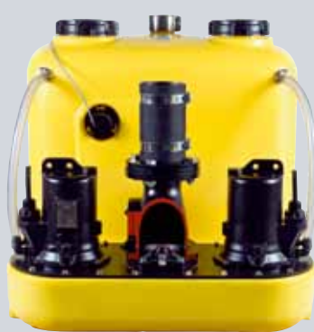
COMPLI 1200 – VOOR MEER VOLUME

Bij meerdere wooneenheden of industriële gebouwen zoals hotels of restaurants is naast meer vermogen ook meer zekerheid vereist. Daarom is de compli 1000 een dubbele installatie met twee pompen op één reservoir. Deze schakelen ofwel afwisselend of werken bij piekbelasting samen.