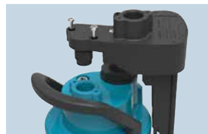
Nouvel accessoire : le Simer Level Control, facilement intégrable dans la pompe.