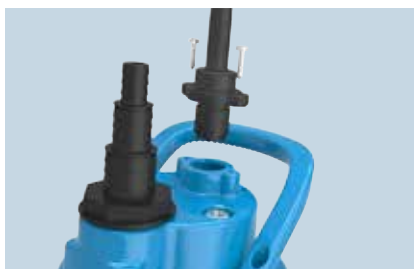
Câble amovible pour un échange de conduite sans effort