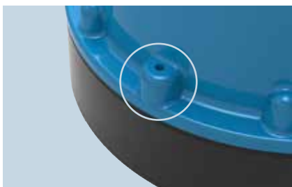
Le clapet de purge permet un démarrage de la pompe en toute fiabilité